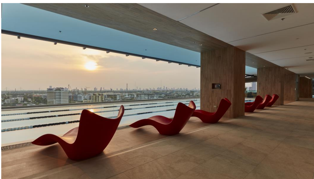
สมาชิก เวอร์จิ้น แอ็คทีฟ 101 สามารถออกกำลังกายในสระว่ายน้ำขนาด 25 ม. และตีร่มกับบรรยากาศและทิวทัศน์แบบพาโนรามาสูงเหนือกรุงเทพฯ